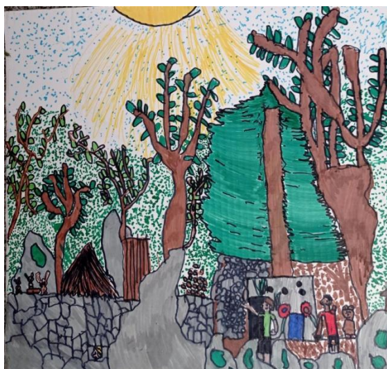
Il bosco dei bambini a Dazio di Lorenzo Molta