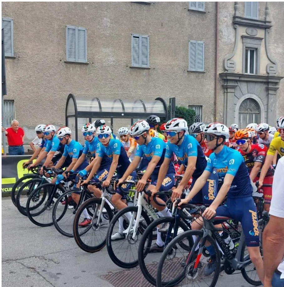
Partenza gara 2° Gran Premio Città di Morbegno