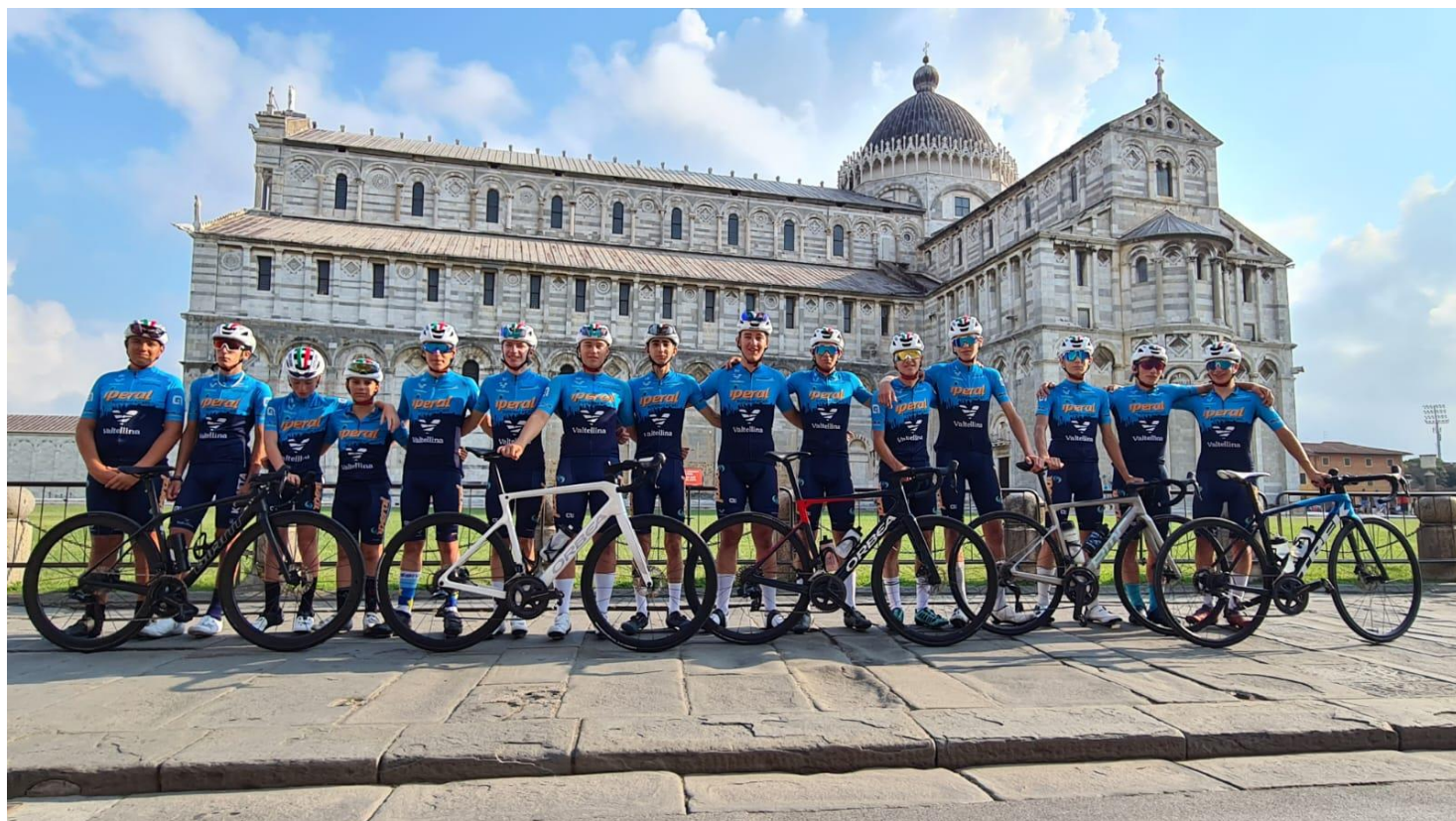
Ritiro a Pisa