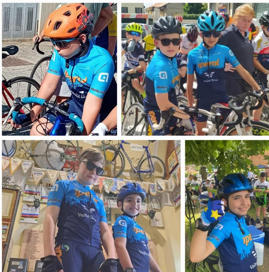
Giovanissimi alle gare