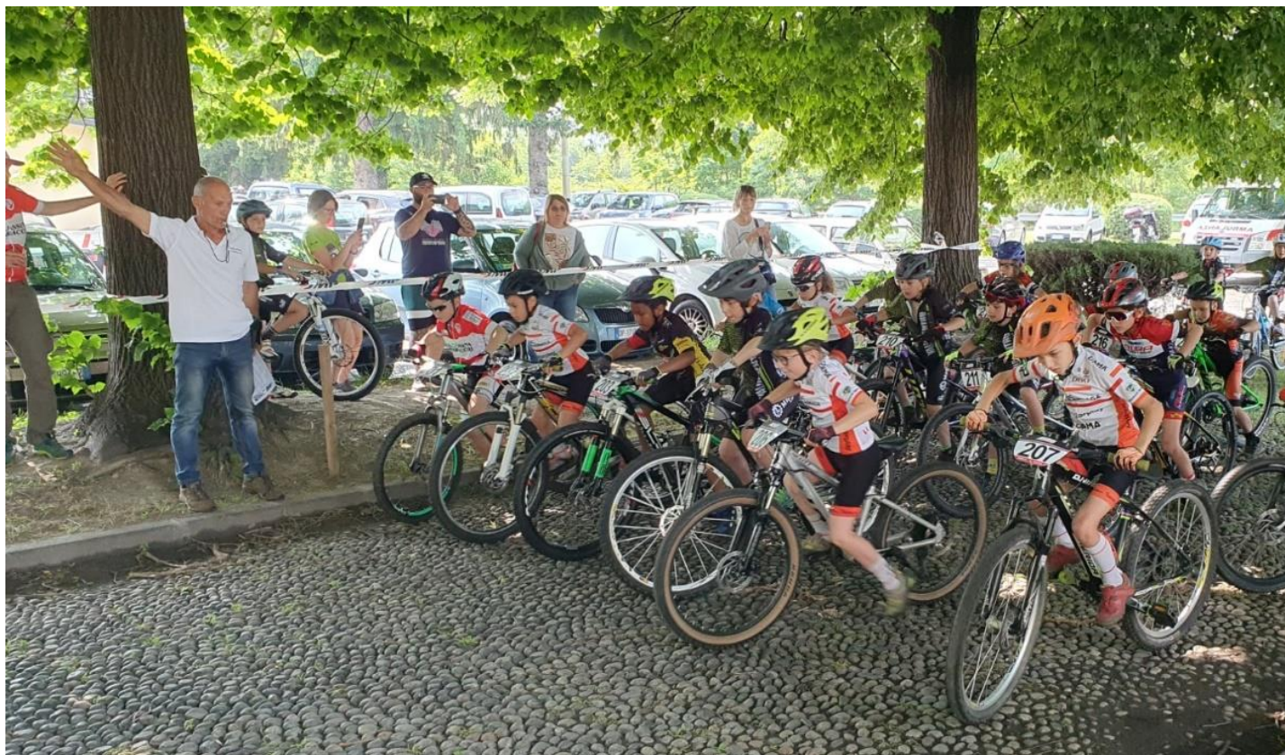
Bike Contest Mantello - Categoria giovanissimi - Partenza