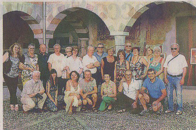
Alcuni protagonisti della prima edizione di "Arte nel chiostro"