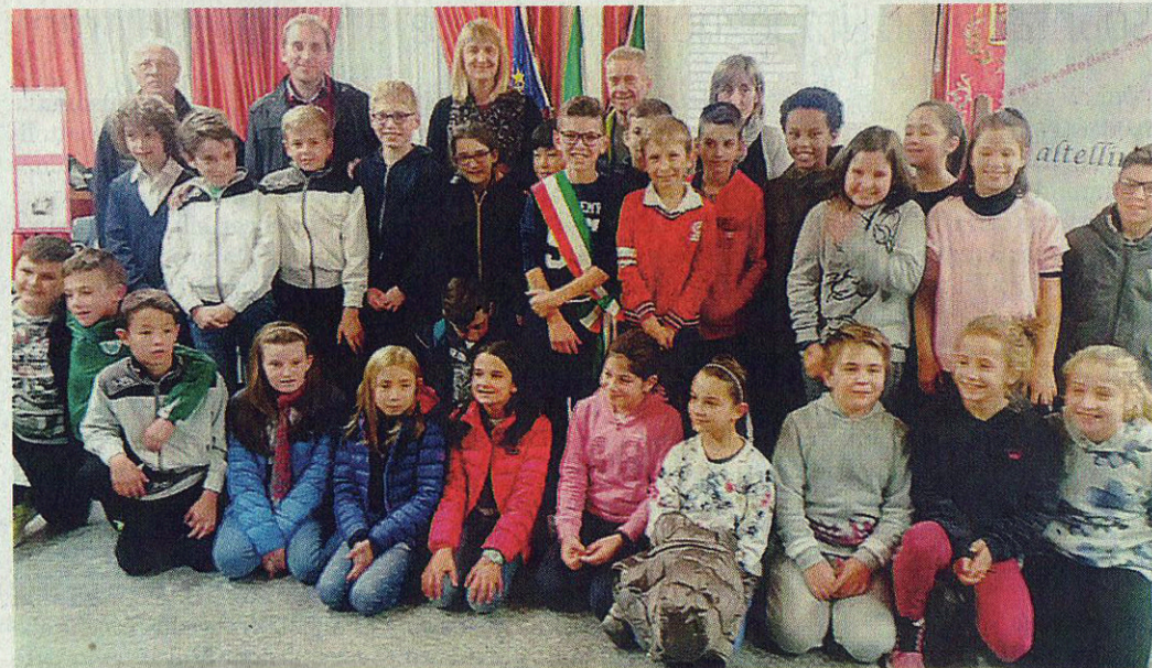
Soddisfazione in sala consiliare per la mostra delle quinte della primaria, promossa da È Valtellina

Il progetto sulla Grande guerra non è il solo che È Valtellina porterà avanti quest'anno con la scuola primaria di Regoledo, a breve protagonista di una nuova iniziativa dedicata ai libri, e rientra nell'intenso lavoro che l'associazione sta conducendo nelle scuole del mandamento con l'obiettivo di promuovere la conoscenza dei fatti che hanno segnato la nostra storia, ma anche la salvaguardia dell'ambiente, la poesia e la cultura del territorio.