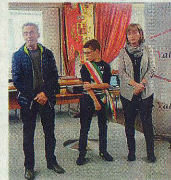
Il sindaco Tommaso Sguario