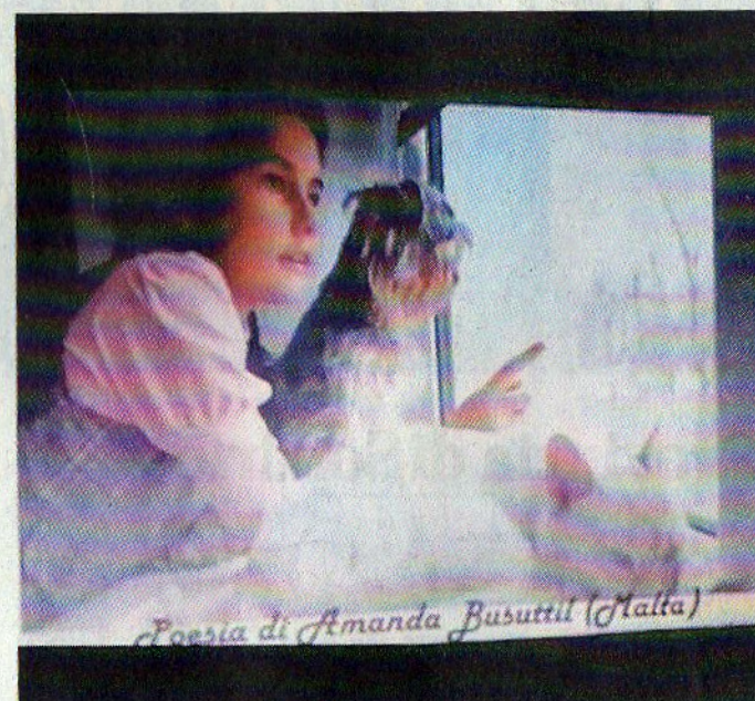
Un momento dal video “Voci dalla quarantena”